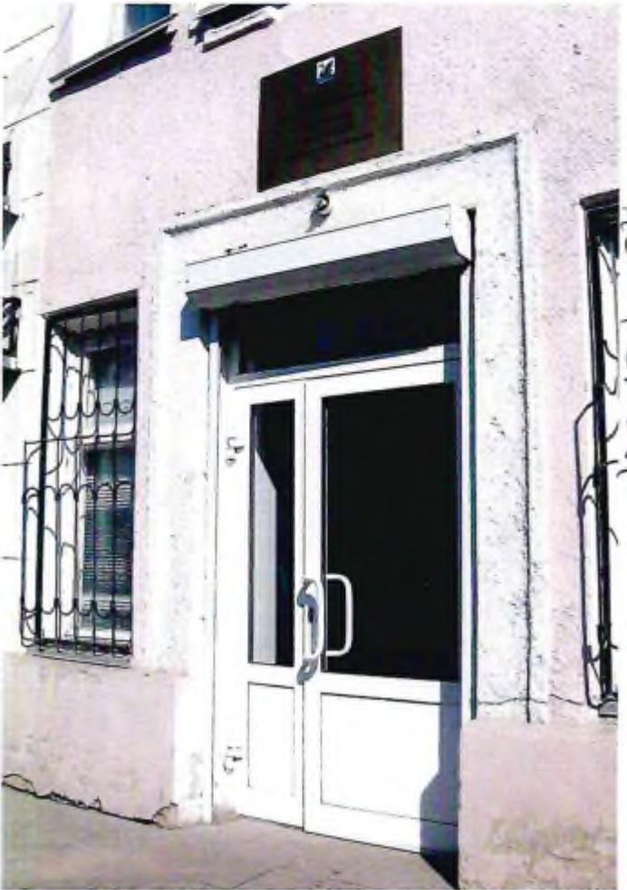
10 - Квартира