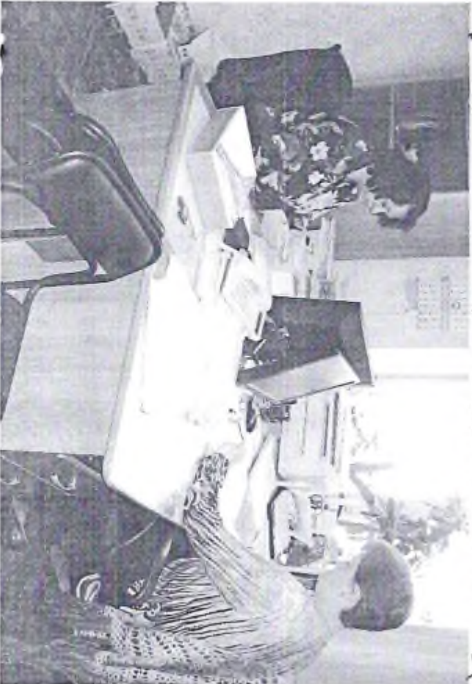
4 - Көрүнөтүрмө сабагынын өтүүсү (ф.6)