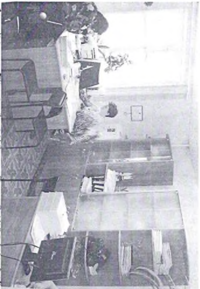
4 - Көрүнөтүрмө сабагынын өтүүсү (ф.6)