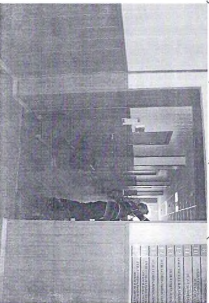
5 - Коридордун көрүнүшү (ф.7)