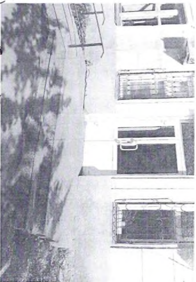
6 - Мектептин көрүнүшү